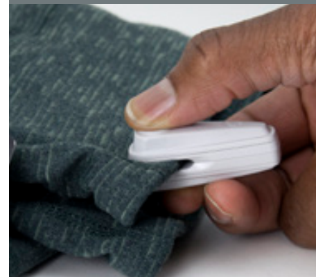
Etiqueta magnética InFuzion

CE Este producto cumple la directiva RoHS II 2011/65/UE y el reglamento (CE) N.º 1907/2006 relativo a la restricción de sustancias peligrosas (REACH), así como las posteriores modificaciones de ambos.