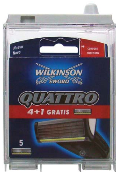
CUCHILLAS DE AFEITAR