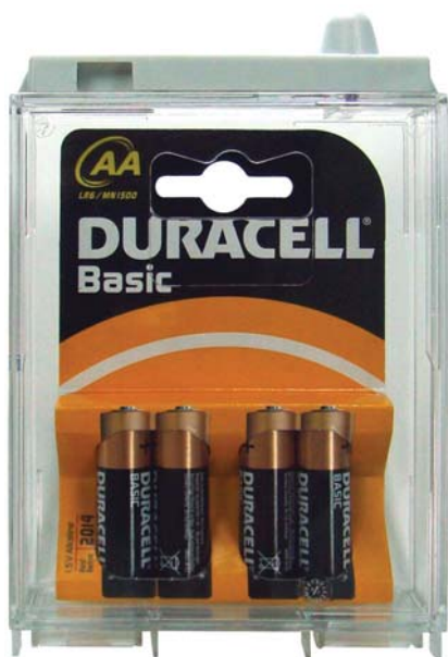
PACK DE PILAS