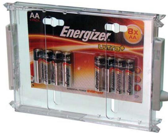
PACK DE PILAS